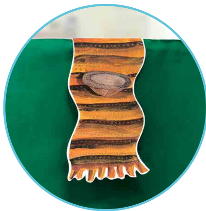
Способ крепления на ширму