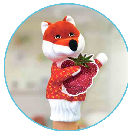
Реквизит для героя сказки