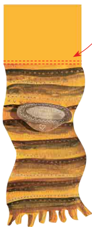
Коврик с миской